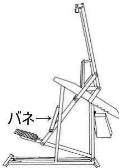
N J - 1 0 外観図