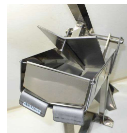
小粒用アダプタ装着